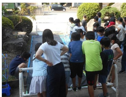
頑張っています！毎日の水やり