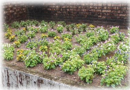
学級委員会「花壇整備」