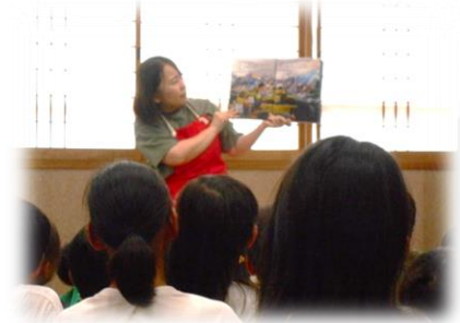
ぴえもんくらぶ「お話会」

6月22日、PTA学級委員会の皆さんによる花壇整備作業が行われ、正門横の花壇が素敵な花でいっぱいになりました。夕方のお忙しい時間に作業をしていただきありがとうございました。