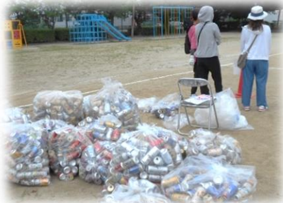
環境整美委員会「リサイクル活動」