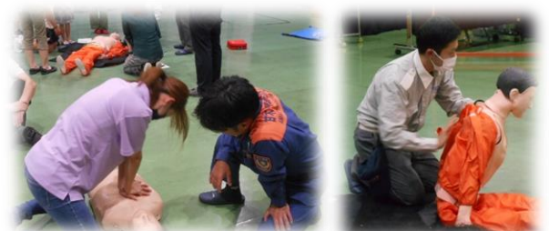
救急救命講習【健康委員会 7/17】

PTA各委員会の皆様には、一学期、様々な活動や学校への支援を行っていただきありがとうございました。特に、学級委員会の皆様には、「なのみ196号」の発刊、健康委員会の皆様には、「救急救命講習」、環境委員会の皆様には、「リサイクル活動」及び夏休みの「愛校作業」、地方委員会の皆様には「危険箇所点検」等にご尽力いただきました。これらの活動は、子どもたちの安心安全、学校教育の充実につながっております。各委員会の皆様、二学期もどうぞよろしくお願いいたします。